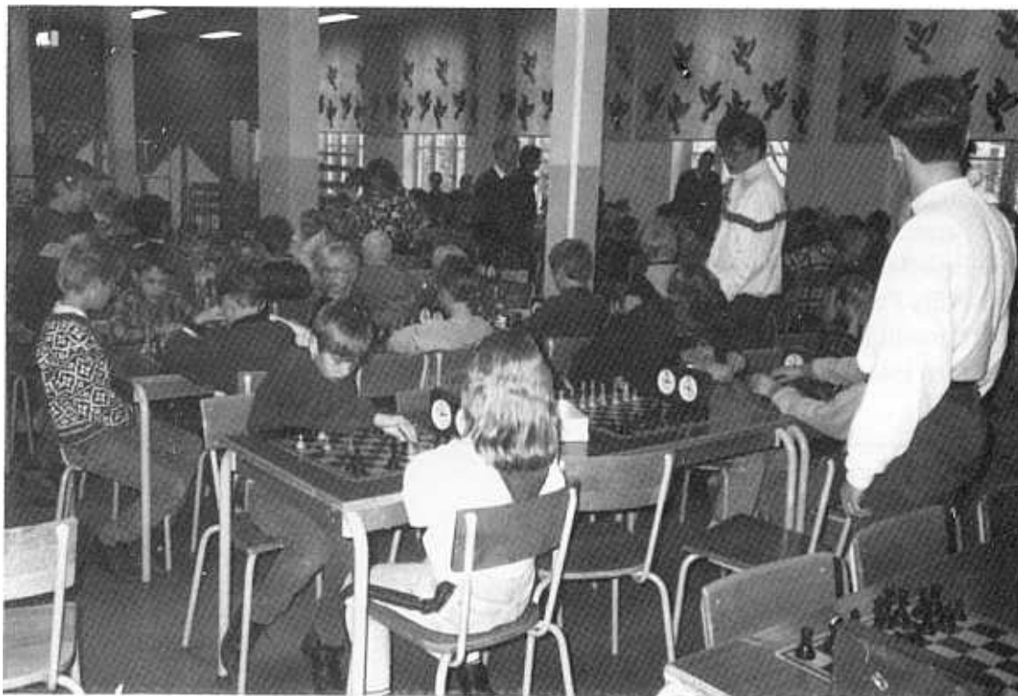
Ungdomsmatch under senare år.