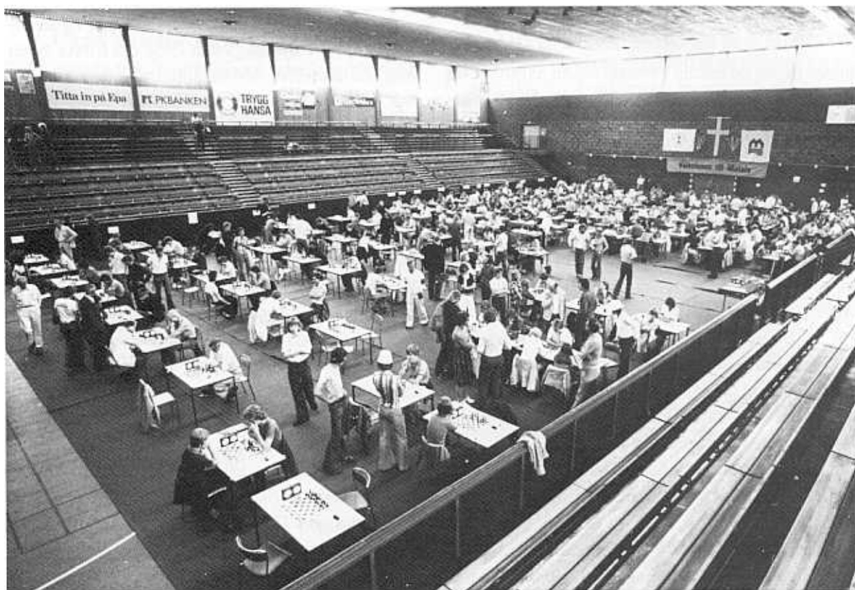
Kongresstävlingarna, Sverigemästerskapet, har arrangerats flera gånger i Östergötland genom åren. Här en utblick över stora salen i samband med SM-tävlingarna i Motala 1976. Detta var andra gången som Motala stod som arrangör för SM, den första var 1946.